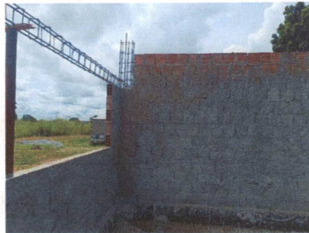
Foto 6: Armadura de aço para as vergas, forma, concreto. Comprova o item 2.3.6