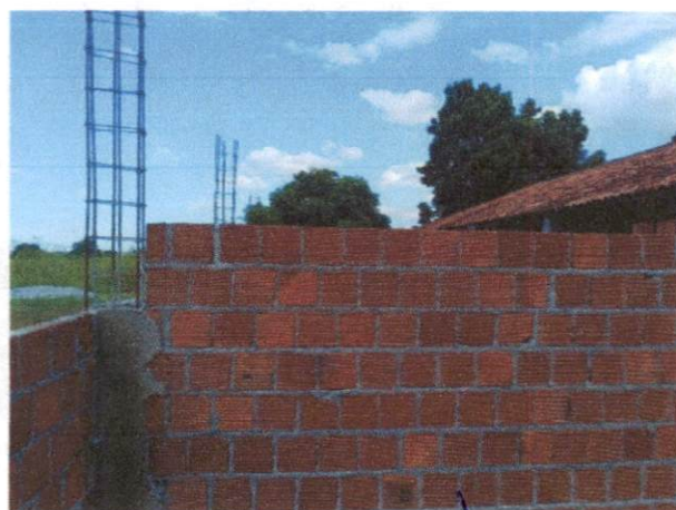
Foto 3: Aço para pilares, forma, concreto. Comprova os itens 2.3.2., 2.3.3, 2.3.4 e 2.3.5.