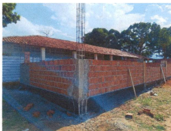
Foto 4: Aço para pilares, forma, concreto. Comprova os itens 2.3.2., 2.3.3, 2.3.4 e 2.3.5.

Prefeitura Municipal de Paudalho/PE Paulo Vanderlei de Mendonça Filho Engenheiro Civil Mat.: 41.498