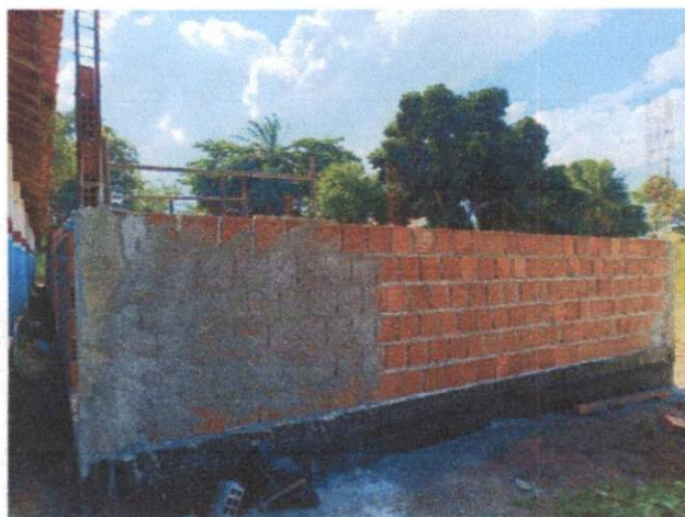
Foto 5: Aço para pilares, forma, concreto. Comprova os itens 2.3.2., 2.3.3, 2.3.4 e 2.3.5.