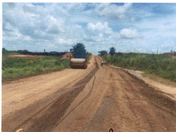
Item: 1.4.1.- BASE ESTABILIZADA GRANULOMETRICAMENTE COM MISTURA SOLO BRITA (70% - 30%) NA PISTA COM MATERIAL DE JAZIDA E BRITA COMERCIAL