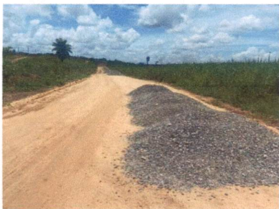
Item: 1.4.1.- BASE ESTABILIZADA GRANULOMETRICAMENTE COM MISTURA SOLO BRITA (70% - 30%) NA PISTA COM MATERIAL DE JAZIDA E BRITA COMERCIAL