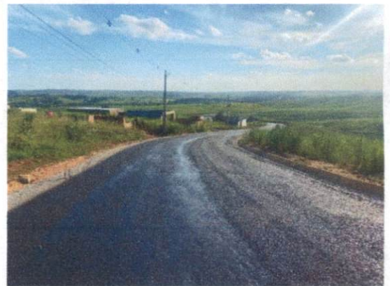
Item: 1.5.2.- EXECUÇÃO DE PINTURA DE LIGAÇÃO COM EMULSÃO ASFÁLTICA RR-2C. AF_11/2019