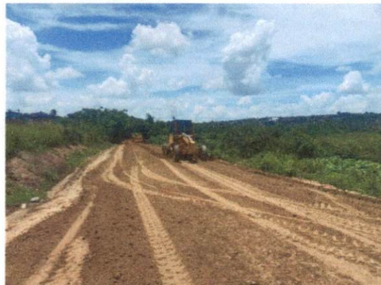
Item: 1.4.1.- BASE ESTABILIZADA GRANULOMETRICAMENTE COM MISTURA SOLO BRITA (70% - 30%) NA PISTA COM MATERIAL DE JAZIDA E BRITA COMERCIAL