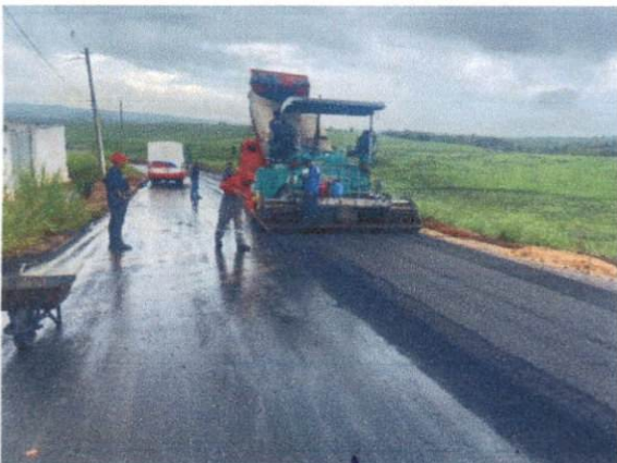
Item:1.5.3. EXECUÇÃO DE PAVIMENTO COM APLICAÇÃO DE CONCRETO ASFÁLTICO, CAMADA DE BINDER - EXCLUSIVE CARGA E TRANSPORTE.