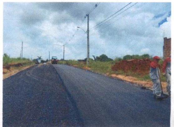
Item:1.5.3. EXECUÇÃO DE PAVIMENTO COM APLICAÇÃO DE CONCRETO ASFÁLTICO, CAMADA DE BINDER - EXCLUSIVE CARGA E TRANSPORTE.