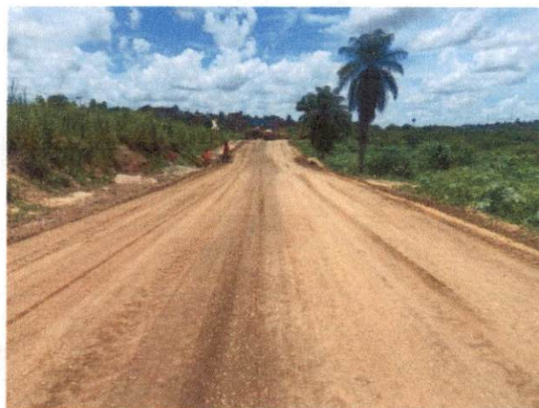
Item: 1.4.1.- BASE ESTABILIZADA GRANULOMETRICAMENTE COM MISTURA SOLO BRITA (70% - 30%) NA PISTA COM MATERIAL DE JAZIDA E BRITA COMERCIAL