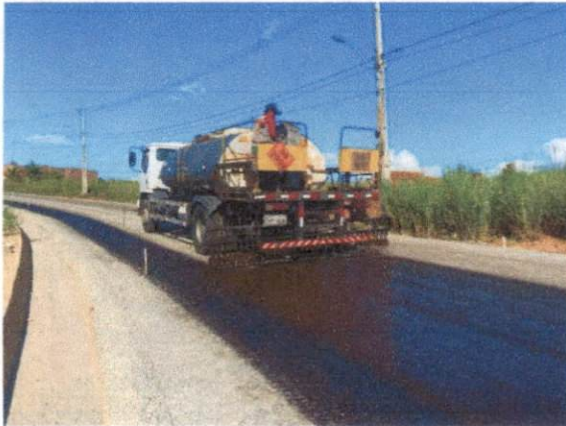
Item: 1.5.2.- EXECUÇÃO DE PINTURA DE LIGAÇÃO COM EMULSÃO ASFÁLTICA RR-2C. AF_11/2019