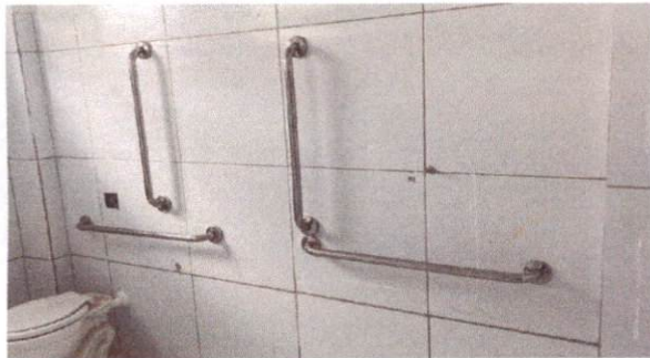
15.14/15.15 Barra de apoio 80 cm, aço inox polido, Deca ou equivalente/Barra de apoio 70 cm, aço inox polido, Deca ou equivalente