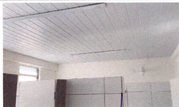
17.4.6 Luminárias 2x40W de sobrepor completa