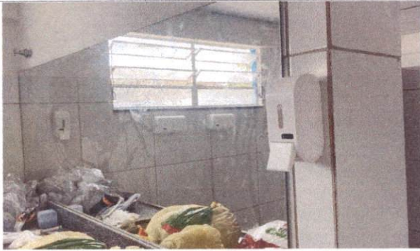
15.12 Dispenser Saboneteira, Melhoramentos ou equivalente