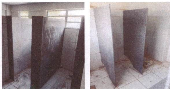
5.1.3 Divisória de banheiros e sanitários em granito com espessura de 2cm polido assentado com argamassa traço 1:4