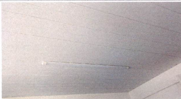
17.4.6 Luminárias 2x40W de sobrepor completa