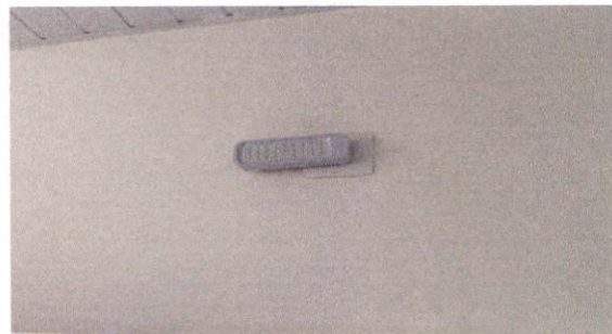
16.2 Luminária de emergência de blocos autônomos de LED, com autonomia de 2h