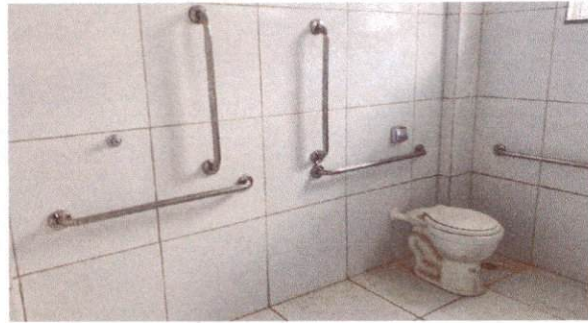
15.14 Barra de apoio 80 cm, aço inox polido, Deca ou equivalente